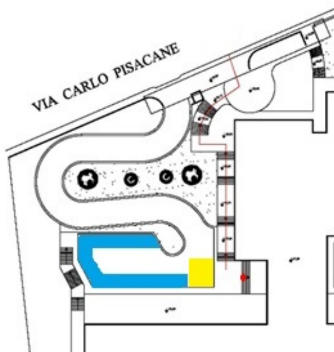
Fig. 2 – stralcio planimetria (ingresso via Carlo Pisacane)

In BLU – superfici di posteggio dei mezzi a due ruote